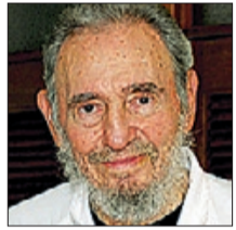
Fidel Castro Expresident de Cuba

Assegurar que els països de Llatinoamèrica veuen amenaçades les seves constitucions per la crisi presidencial d'Hondures sona poc legítim en boca de qui va estar dècades al poder sense que hi hagués democràcia.