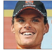
Luis León Sánchez Ciclista

El vencedor de l'etapa d'ahir del Tour de França no només es va anotar un èxit esportiu, sinó un gran gest personal al dedicar el triomf al seu germà, mort en un accident de circulació el 2005.