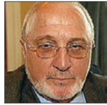
Joan Torres Ferrocarrils de la Generalitat

La culminació de l'adaptació per a les persones amb mobilitat reduïda de totes les estacions de la línia Llobregat-Anoia és un bon indicador de la sensibilitat social de l'empresa ferroviària autònoma.